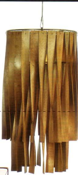
מנורת ביסלי שאריות דיקט שעברו עיבוד וקיבלו טוויסט